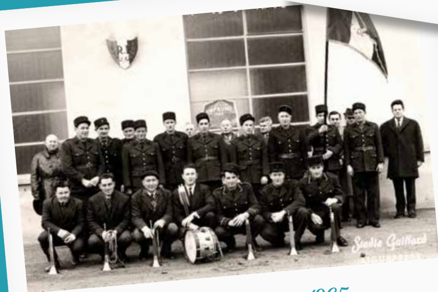
Banquet des pompiers en 1965