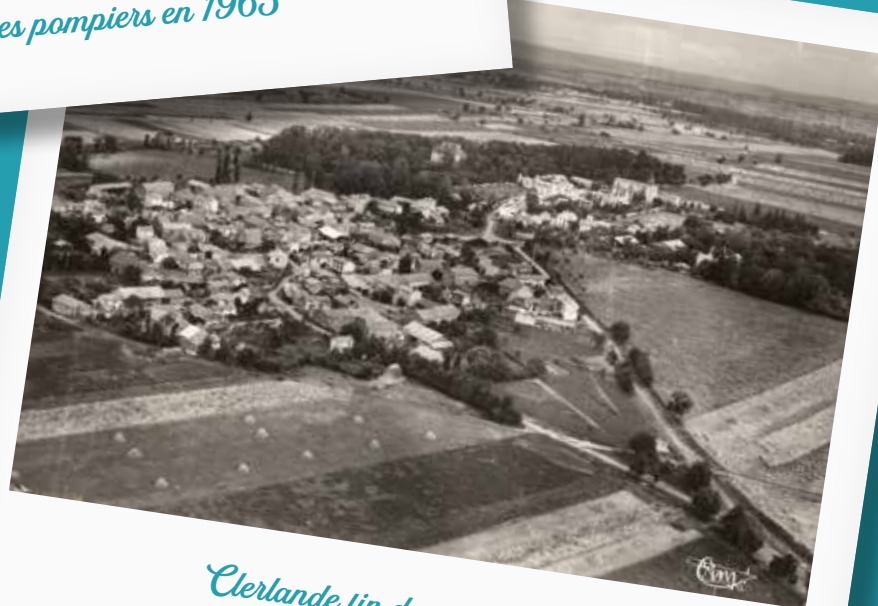
Clerlande fin des années 50