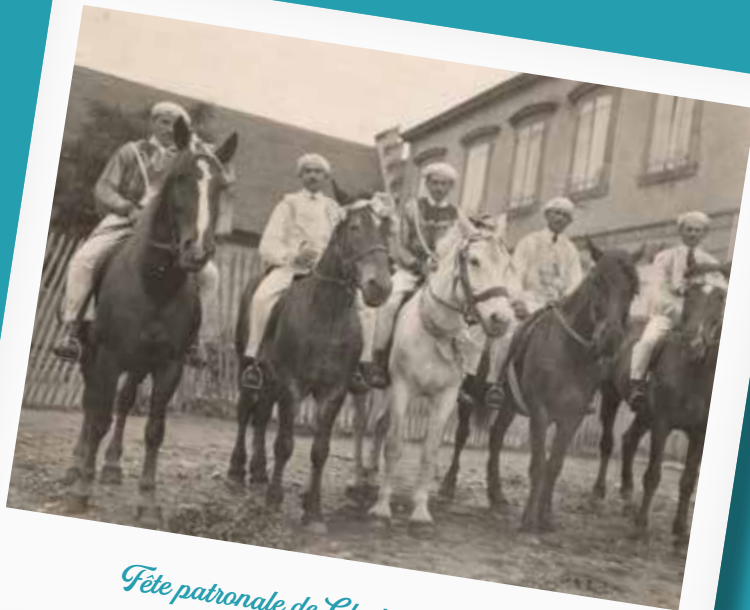
Fête patronale de Clerlande en 1920